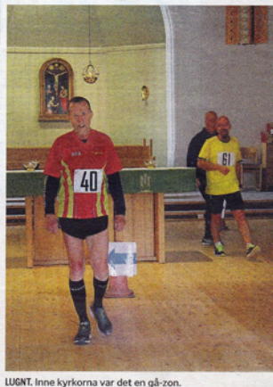
LUGNT. Inne kyrkorna var det en gå-zon.