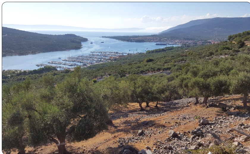
Ovanför Cres town