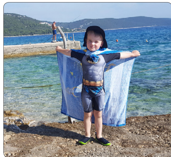
Redo för bad i vackert hav