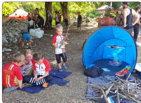
Aktiviteter vid TA på berget vid Beli, Cres

de. En av oss provade nämligen att trampa på en sjöborre som dessutom stack genom skorna. Ej att rekommendera.