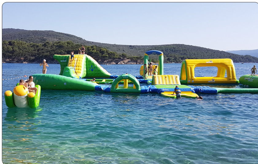
Lufifylld äventyrsbana i havet