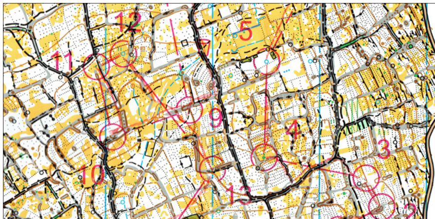
Dag 1 Kroatien. Vuxenbana. Stenmurs- och stenhögsnavigering på hög nivå!