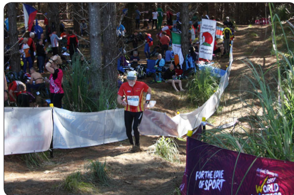
Bana M65-1, Långkval 2