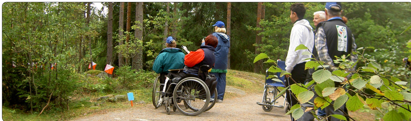
Bilden togs under Pre-O vid VM2004 på Rocklundaspåret.