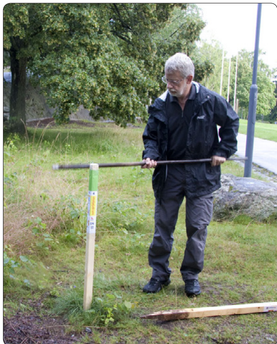
Stolpe 4 har just fått en ansiktslyftning av Hans