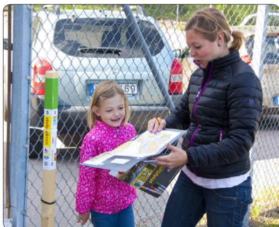
Stolpe 5 - den mest besökta stolpen. Den står utanför ICA Gryta