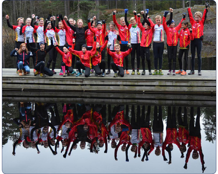
OV-gänget vid Lillsjön