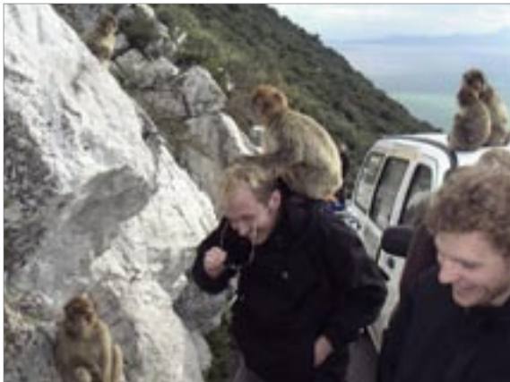
Aporna kunde bli rätt närgångna i Gibraltar.

Tidigt i ottan, Fredagen den 25e Mars, startade åtta VSOK:are resan mot Spanien. Ett tiotal mil norr om Gibraltar skulle vi tillbringa den närmsta veckan, med träning, nöje och förhoppningsvis en hel del sol och värme.