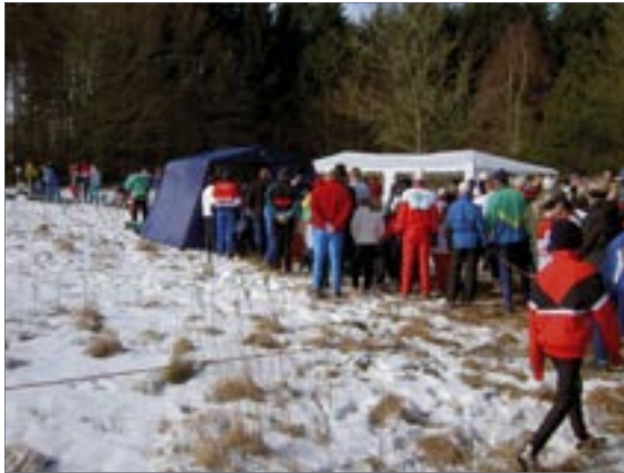
Första dagen av Nordjysk 2-dagars! Dagen inleddes med snöstorm men vid start var det bara storm.

Första inviten kom redan under vårt eget VM. Det var VM-arrangörerna 2006, Danmark som ville veta hur man gör ett lyckat arrangemang. Så under hösten bestämdes att vi skulle åka till dem i början av mars för en träff. Det verkade väldigt bra då för i mars är det vår söderut med både värme och sol. Mötet skulle ske på norra Jylland för att vår resa skulle bli kortare och för att kombinera den med Nordjysk 2-dagars. Kul!